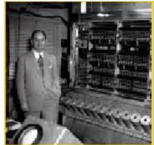
Newman & IAS